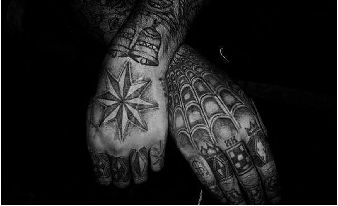
Иллюстрация 2. Примеры криминальных татуировок

Маркеры склонности к совершению акций типа «Колумбайн» 14 и (или) террористическим актам