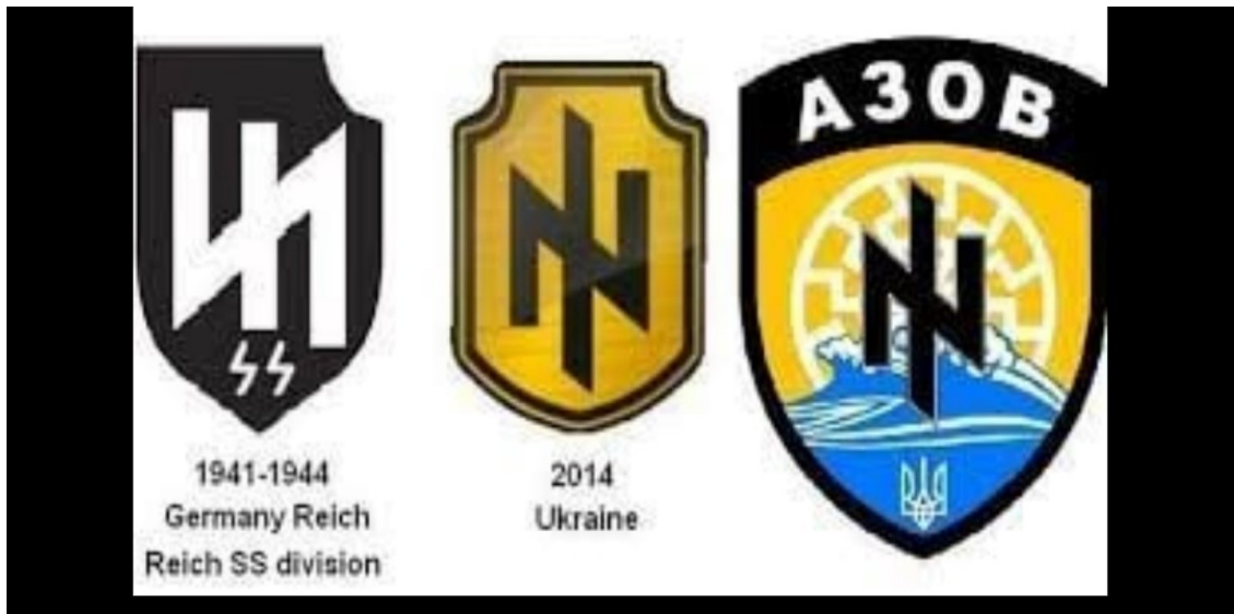
Рис. 2 Атрибутика украинских неонацистов и ее сходство с атрибутикой немецких нацистов прошлого века.